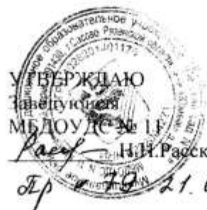
ГРАФИК ПРОВЕДЕНИЯ «Дней охраны труда» на 2017-2018 учебный год

День охраны труда в МБДОУДС № 11 проводится в третью пятницу каждого месяца, согласно Положения о Дне охраны труда ДОУ.